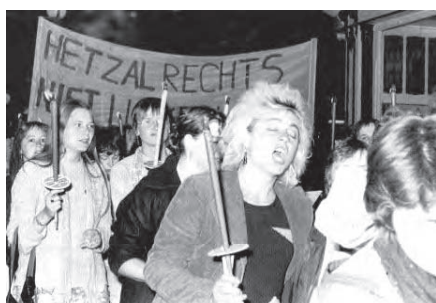
Een foto van de eerste heksennacht.