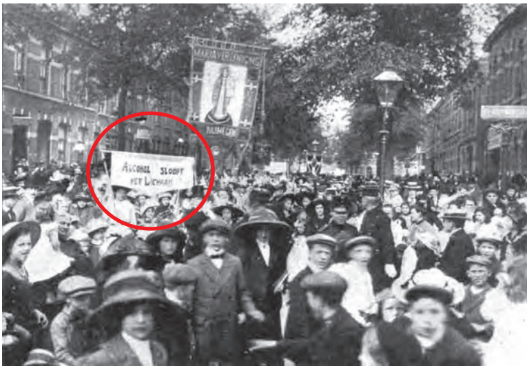
Propaganda optocht van de Maria vereniging.

Op 7 juni 1913 was er een propaganda optocht van de Maria Vereniging door Nijmegen, met spandoeken van de in die tijd overal aanwezige drankbestrijdingleuzen. In de hoogtijdagen (rond 1920) waren er zo'n 150.000 mensen die actief betrokken waren bij de alcoholbestrijding ten opzichte van zo'n 30.000 probleemdrinkers. Terwijl er tegenwoordig ongeveer 4.000 mensen zich inzetten voor de alcoholbestrijding ten opzichte van zo'n 150.000 probleemdrinkers. Als overkoepelende term werd in 1920 de anti-alcohol-propaganda toegeschreven aan de Blauwe beweging. Het doel van deze beweging was de volksverheffing. Alcoholisme werd niet in de eerste plaats gezien als gezondheidsprobleem, maar als een sociale kwestie. Drankbestrijding paste in het rijtje van het stakingsrecht, de achturige werkdag en het vrouwenkiesrecht. Een leus die veel werd gebruikt in die tijd was: "Drinkende arbeiders denken niet. Denkende arbeiders drinken niet."