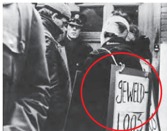
Foto van de demonstratie voor de raadszaal en een foto waar de demonstranten tegenover de politie met protestborden aan het lichaam benadrukken dat ze gewelddoos willen protesteren .