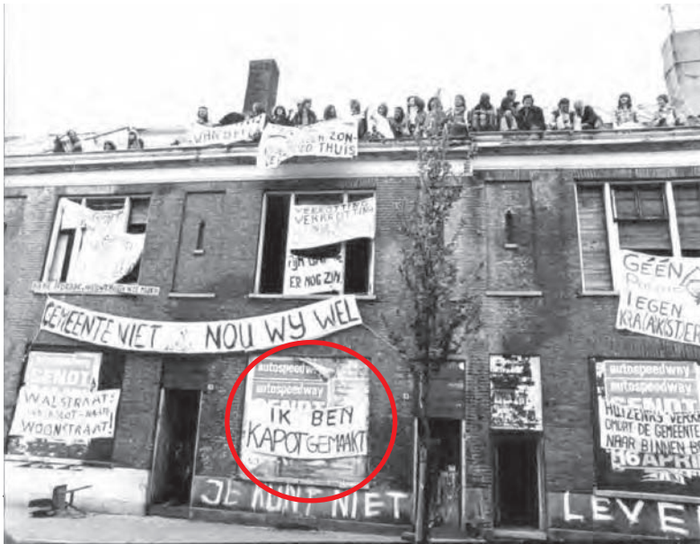
krakers op de daken in de tweede Walstraat 83.

De krakersbeweging in Nijmegen is vanaf de jaren 70 en in de jaren 80 zeer actief geweest. Kraken is het in gebruik nemen van een ongebruikte ruimte, terrein of pand zonder toestemming van de eigenaar. De woningnood en daarnaast de leegstand leidde er toe dat men het recht in eigen hand nam. Ook kon niet iedereen de hoge huren (400 of 500 gulden) betalen. Kraken bood het alternatief. Op de tweede Walstraat stond een huizenblok dat gesloopt zou gaan worden. De krakers die het blok in gebruik hadden genomen protesteerden tegen deze sloop. De demonstratie speelde zich af op het dak. De bewoners hadden de facade volgehangen met spandoeken en zaten zelf op het dak.