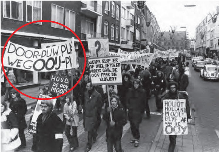
Een demonstratie van zo'n honderd mensen die al lopende door de stad groter werd omdat er mensen spontaan aansloten. Teksten op spandoeken: 'Neem ons niet in het ooitje', geen geklooi met de ooij, etc.

Op 27 November 1972 werd er gedemonstreerd tegen de verlenging van de Waalbocht in het Ooij. Rijkswaterstaat wilde de Waalbocht verlengen zodat er grotere duwbotten doorheen zouden kunnen. De demonstratie was georganiseerd door actiecomité het Groenlanden en er liepen zo'n 100 mensen mee. Veel mensen sloten zich in de binnenstad spontaan aan bij de stoet. Ook had het actiecomité 30.000 handtekeningen verzameld tegen de verlenging van de Waalbocht. Deze ingreep zou volgens de actievoerders het unieke karakter van het Ooij-landschap aantasten. Het actiecomité wilde een kamerdebat aangaande de kwestie afdwingen. In de jaren '70 zijn er veel protesten omtrent de rivieren in Nederland geweest. Er werden in die tijd veel plannen gelanceerd voor omleggingen en dijkverhogingen. Het grootscheepse protest tegen de verlenging van de Waalbocht heeft indertijd ervoor gezorgd dat deze ingreep niet heeft plaatsgevonden. Tegenwoordig is het protest om het karakter van het Ooij landschap te behouden nog steeds actueel. Ditmaal betreffen het acties tegen de plannen voor het creëren van overloopgebieden in het gebied. Ook nu hebben de protesten van Het Hoogwaterplatform ervoor gezorgd dat de Ooijpolder behouden blijft.