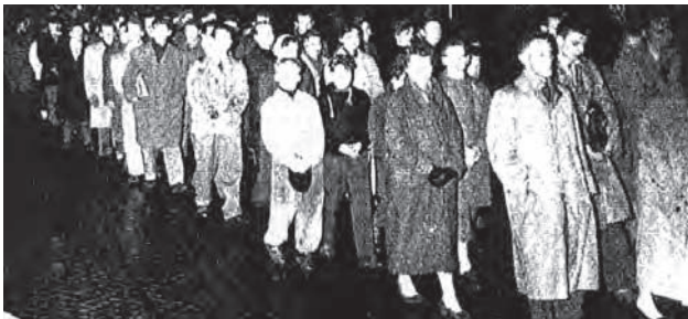
Krantenfoto's van een demonstratie en een stille tocht op het 'plein 1944'.

Op 23 november 1956 brak er een massale volksofstand uit tegen het Stalinistische bewind in Hongarije. Deze opstand staat bekend als de Hongaarse opstand en begon als een vreedzame steunbetoging aan de inwoners van het Poolse Poznan waar een bloedige opstand tegen de Russen in juni was neergeslagen. De sfeer werd echter snel grimmiger. Hongaarse opstandelingen haalden een beeld van Stalin neer, verwijderden emblemen van de volksrepubliek op officiële gebouwen en beschoten de kazernes van de geheime politie. De regering vroeg de Sovjet Unie om hulp. Op 4 november 1956 vielen Russische troepen het land binnen en sloegen de opstand neer. Boedapest werd omsingeld en de tanks reden de straten binnen. De Hongaren trachtten ze met molotovcocktails tegen te houden, terwijl via de radio het Westen om hulp werd gevraagd. Het mocht niet baten. De opstand kostte duizenden mensen het leven en 150.000 Hongaren sloegen op de vlucht.