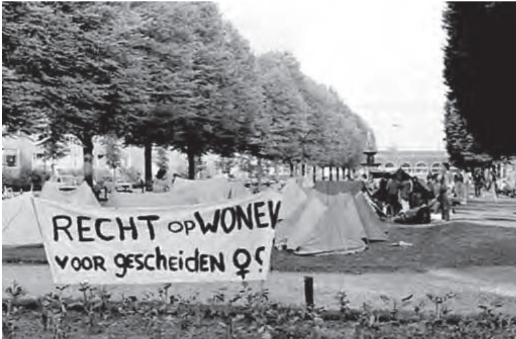
De foto toont het spandoek op de Schaek Mathonsingel met daarachter de tenten waar de vrouwen tijdelijk verbleven.

Het Blijf-van-mijn-Lijf-huis in Nijmegen opende toen huiselijk geweld nog in de taboesfeer lag. Het huwelijk was beschermd. Politie mocht destijds niet ingrijpen bij huiselijk geweld. Het Blijf-van-mijn-Lijf-huis was een huis met een geheim adres waar vrouwen die slachtoffer waren van huiselijk geweld werden opgevangen. In Nijmegen werd het vierde Blijf-van-mijn-Lijf-huis in Nederland geopend in 1977. De opvang was gevestigd in een pand die de initiatiefnemers van het Blijf-van-mijn-Lijf-huis hadden gekraakt. Ze waren tot deze actie overgegaan omdat er in de gemeenteraad niet werd ingegaan op de vraag naar een geschikt pand. De dames van het Blijf-van-mijn-Lijf-huis werden afgescheept met de bewering dat er in Nijmegen geen sprake van huiselijk geweld was. Het kraakpand zat echter in mum van tijd vol.