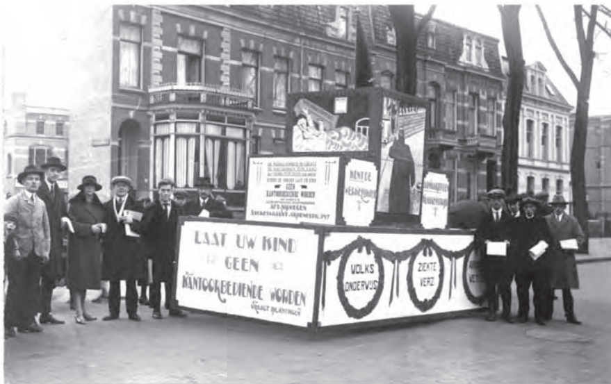
Demonstratiewagen van de Nederlandse Bond van Handels- en Kantoorbedienden, afdeling Nijmegen.

Tijdens de eerste wereldoorlog werd er geld bijgedrukt om de oorlogsindustrie te financieren. Ook werd in Amerika meer voedsel geproduceerd dan voorheen om vervolgens naar Europa te exporteren. De investeringen van de Amerikaanse boeren berustten op fictief geld en hadden zich aan het einde van de eerste wereldoorlog nog niet terugbetaald. Daarnaast bleven de boeren in het vervolg met een overproductie zitten. De uiteindelijke onvermijdelijke inzinking kwam in oktober 1929. De Amerikaanse beurs stortte in elkaar doordat er onder de aandeelhouders en speculanten een sneeuwbaaleffect ontstond. De banken hadden geen reserves want al het geld was uitgeleend. De crash werd nagevolgd door alle beurzen in de wereld, waardoor plotsklaps de schijnbare economische groei tot stilstand kwam. De grote crisis van de jaren 30 was in alle hevigheid losgebarsten.