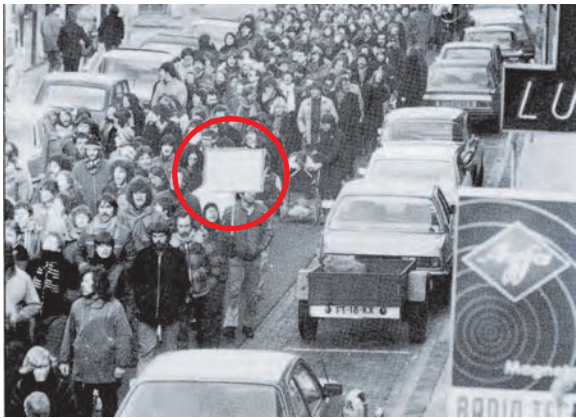
Op 23 Januari 1981 demonstreerden 5000 mensen tegen de Zeigelhofgarage en de tweede foto is genomen op 25 Februari en toont een demonstratie met 10.000 mensen.