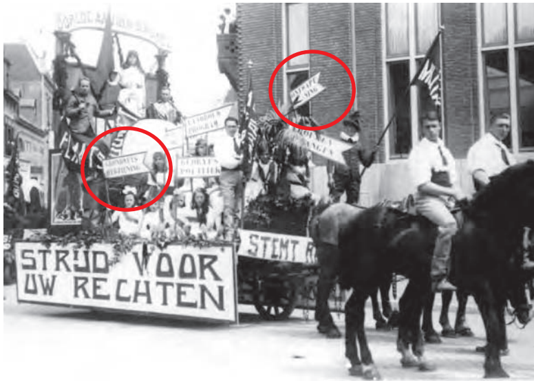
'De stem des volks' praalwagen in de Molenstraat.