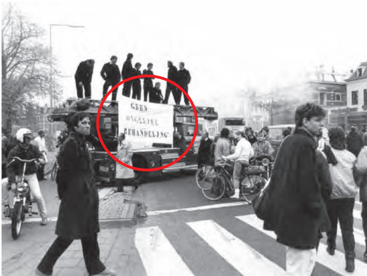
Een foto van een staking van de brandweer op het Keizer Karel plein in November 1983.

In 1983 kondigde minister Rietkerk van Binnenlandse zaken een brutosalaris korting van 3,5% aan voor het (semi)overheidspersoneel (ambtenaren, trendvolgers en uitkeringsgerechtigden) dit waren toentertijd bij elkaar zo'n 4 miljoen mensen. Door het gehele land kwamen protesten op gang. De ambtenarenacties georganiseerd door de AbvaKabo waren lang en fel. De demonstraties en stakingen hielden met elkaar wel 2 maanden aan. Dit had bijvoorbeeld als gevolg dat het huisvuil niet meer werd opgehaald, wat natuurlijk nogal negatieve consequenties had. Het mocht niet baten want de bezuinigingen zijn gewoon doorgegaan. Minister Koos Rietkerk was de gebeten hond. Er werden stickers en buttons via de vakbond verspreid met de slogan: 'Boos op Koos'