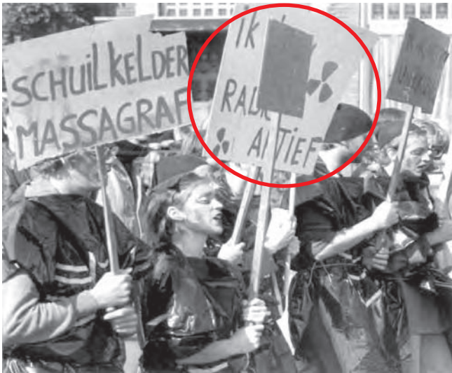
Een foto van een demonstratie op plein 1944 in 1981.