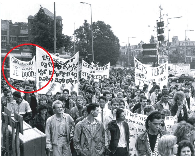
Demonstratie op het Keizer Karel plein 9 Juli 1988.