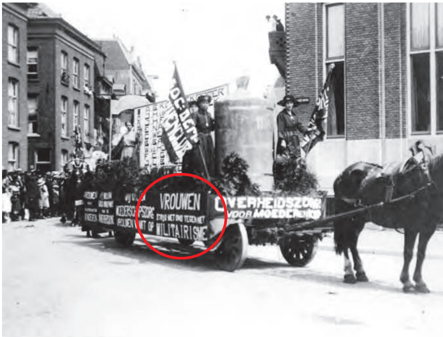
De praalwagen van de S.D.V.C (Sociaal Democratische Vrouwen Club) in de Molenstraat.

In 1890 kregen vakorganisaties een voet aan de grond. De strijd om erkenning en voor betere arbeidsvoorwaarden kreeg een meer permanent en landelijk karakter. In dezelfde tijd kreeg Nijmegen met stakingen te maken.