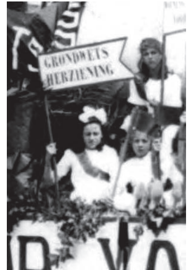
Vergroting van de vaandel.