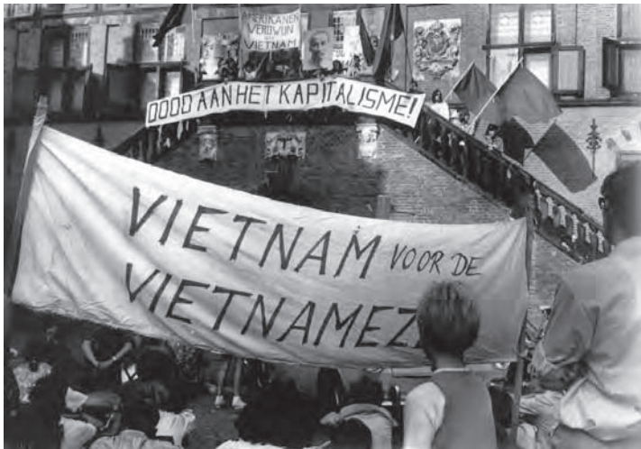
De massale demonstratie bij de grote markt.