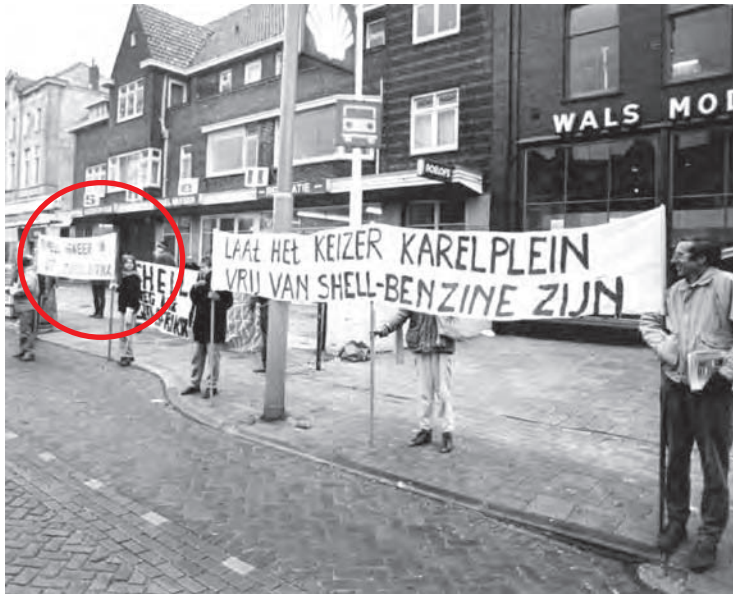
Een foto van een kleinschalige demonstratie voor het Shell benzine station aan de Graafseweg.