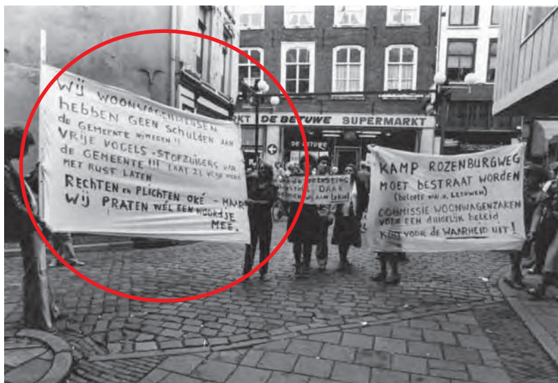
De foto toont een demonstratie van woonwagenebewoners van het kamp Rozerburgweg op de Lange Hezelstraat.