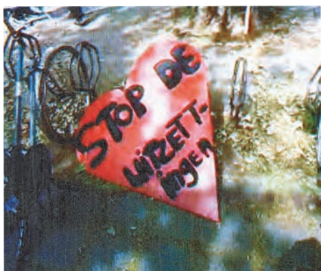
Hartje werd ook gebruikt tijdens bezoek van koningin Beatrix, op haar tocht door de stad kwam ze dit protestbord tegen in de Tweede Walstraat.