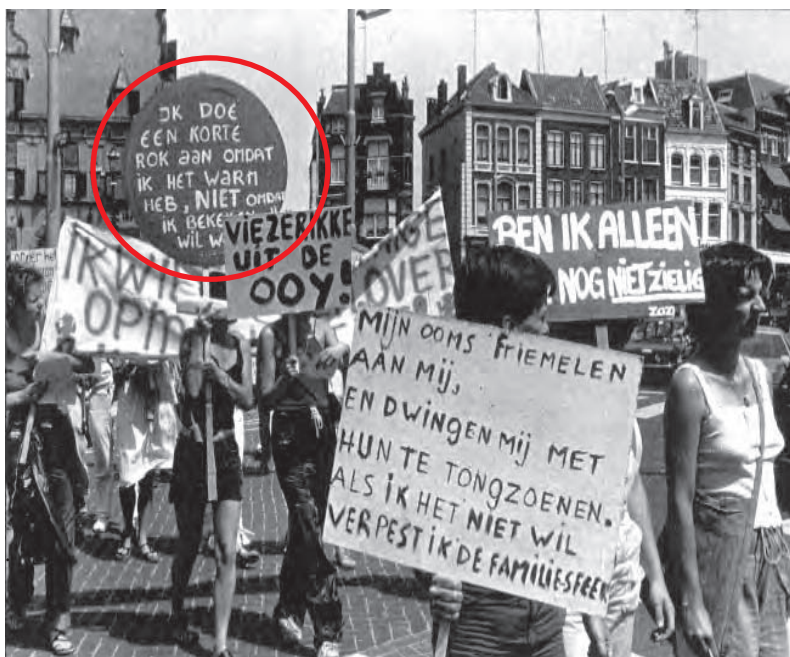
De opname laat een demonstratie zien van vrouwen tegen schending van de seksuele integriteit.