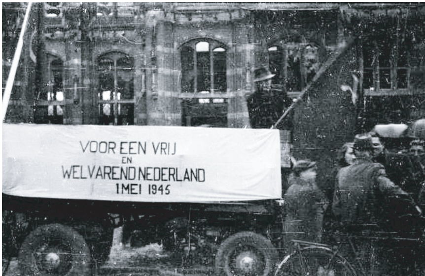
Deze afbeelding toont een spandoek op een boerenwagen die diende als podium waarvandaan de mensenmassa werd toegesproken. De toespraak werd waarschijnlijk op de grote Markt georganiseerd. De toespraak vond plaats in een stad die een grotendeels verwoest was.

Na de oorlog werd de eerste dag van de arbeid aangegrepen om een gemeenschappelijke socialistische samenwerking aan te gaan. De SDAP (Sociaal Democratische Arbeiders Partij) zocht samenwerking met de CPN (Communistische Partij Nederland) voor de viering van de dag van de arbeid. Door een flinke onenigheid werd de gezamenlijke viering op het laatste moment toch afgelast. De CPN organiseerde daarom een eigen bijeenkomst op 1 Mei en sprak enkele honderden mensen toe op een regenachtige dag. Aan weerszijden van de sprekers stonden twee grote communistische vlaggen.